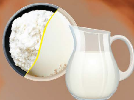
Заменитель сухих сливок