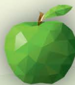
ФМ Зелёное яблоко 1 литр