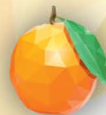
ФМ Красный апельсин 1 литр