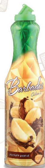
Арахис в шоколаде