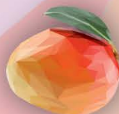
ФМ Манго 1 литр