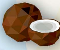
ФМ Кокос 1 литр