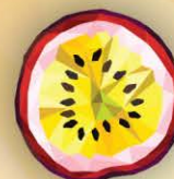
ФМ Маракуйя 1 литр