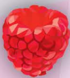
ФМ Малина 1 литр