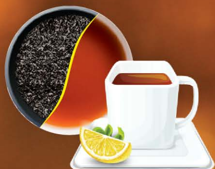
Чёрный чай со вкусом лимона