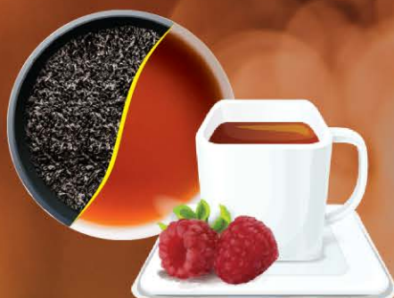
Чёрный чай со вкусом малины