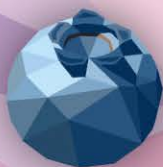
ФМ Черника 1 литр