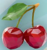
ФМ Вишня 1 литр