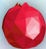
ФМ Клюква 1 литр