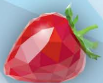
ФМ Клубника 1 литр