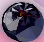
ФМ Чёрная смородина 1 литр