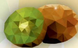
ФМ Киви 1 литр