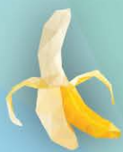
ФМ Банан 1 литр